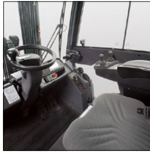
Bequemer und leistungsfördernder Arbeitsplatz