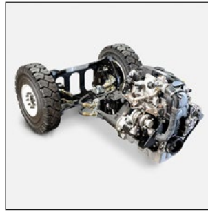
VW-Motoren mit geringen Verbrauchswerten